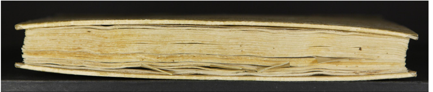
Magl. A.5.64